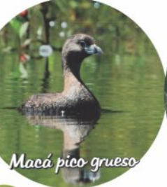
Macá pico grueso