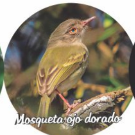
Mosqueta ojo dorado