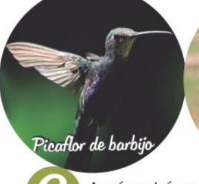
Picaflor de barbijo

4 Mirando hacia el monte se puede encontrar en esta estación, el Carpintero común (el Carpintero más chico de la zona, con solo 8 cm) y la Mosqueta ojo dorado . Ambas aves de muy difícil observación. Mirando hacia el río se puede escuchar y observar al Martín pescador grande . Otras especies observadas en este lugar: Tacuarita azul, Piojito común, Curucucha, etc. Entre estas estaciones, si afinamos el oído, se puede escuchar el sonido triste de la Yerutí común , un tipo de paloma más oída que vista.